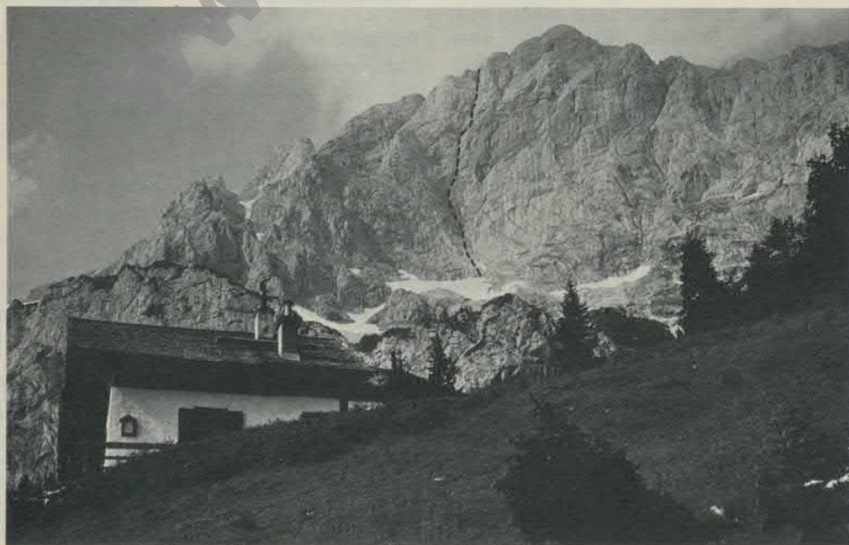
Gr. Häuslhorn, Reiteralpe Südwand - Bergvagabundenweg

Zugang: Zwischen Lofer und Unken zweigt eine schmale Straße nach Au ab. Weiter auf schmaler Sandstraße bis zum Gasthaus Mayerberg. (Bis hierher mit Auto möglich.) Den Weg zur Mairbergscharte verfolgen, bis man ein herrlich gelegenes Jagdhaus unterhalb der Häuslhorn-Südwand erreicht hat. Ein bis zwei Gehminuten weiter zieht links ein kaum erkennbares Jagdsteiglein erst durch den Wald, später durch die ausgehauenen