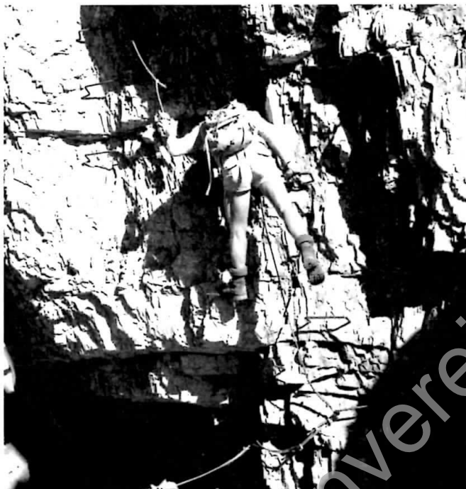
Seite 2: Die Illspitze von Süden

Stützpunkt: Die Tour kann vom Tal aus an einem Tag unternommen werden, unter Umständen Übernachtung auf der Innsbrucker Hütte (2369 m).