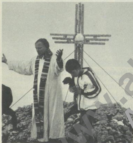
Das neue Kreuz auf dem Nixriedl

Sicher ist es allen Bergsteigern aufgefallen, daß die Gipfel längst nicht mehr für die Zahl der Kreuze ausreichen; so gibt es Gipfel mit zwei, ja gar drei Kreuzen oder oft, wie in Italien, noch mit einer Reihe Madonnenstatuen (nun ja, die andere Seite hat eben ein paar bronzene oder gipsene Leninbüsten auf ihren hehren Höh'n). Daß bei dieser sakralen Schwemme viel Kitsch dabei ist, wissen wir; wir wissen auch, daß selbst die gottesfürchtigsten Bergsteiger gern auf Kreuze klettern, um so zu zeigen, was sie davon halten (wie Peter Habeler, der auf jedes Kreuz steigt, wenn es ihm nicht allzu einsturzfährdet erscheint). Ein neues und zudem recht geschmackvolles Kreuz wurde nun zu Ehren der verunglückten Bergrettungsmänner auf dem Nixriedl (2560 m, Berchtesgadener Alpen, Hochköniggruppe) aufgestellt und eingeweiht.