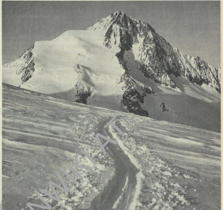
Die Berner Alpen waren für den Skipionier Wilhelm Paulcke beliebtestes Tourenziel; Finsterrhorn von der Grünlucke

Tag stand die Jungfrau auf dem Programm. Am Rottalsporn wurden die Ski zurückgelassen, in 3700 Meter Höhe zwang die Lawinengefahr zum Gipfelverzicht. Nach einer eiskalten Nacht in der Concordiahütte wurde die Abfahrt über den Aletschgletscher, den längsten Gletscher der Alpen, zu einer wirklichen Bewährungsprobe. Im unteren, zerklüfteten Teil fuhr man angeseilt. Von den Oberaletschhütten stiegen die fünf hungrigen und ausgefrorenen Skiläufer zum Hotel Belalp, in der Hoffnung, dort Menschen anzutreffen. Enttäuschung! Man beschloß, den Eispickel als Hausschlüssel zu verwenden. Und dann feierten die Freunde. Rotwein entnahmen sie einem Fäßchen. Er war so sauer, das sie ihn nur mit Saccharin genießen konnten. Als sie dem Hotelbesitzer den Einbruch beichteten, erfuhren sie, daß sie Essig getrunken hatten (s. auch BM 2/82, S. 14).