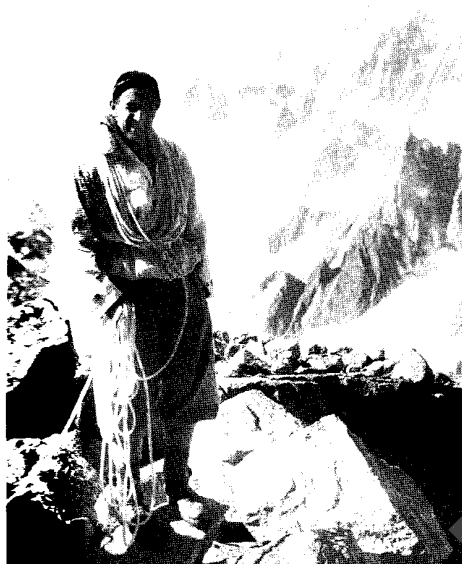
Der Genfer Allroundbergsteiger André Roch auf dem Petit Dru, im Hintergrund der Montblanc