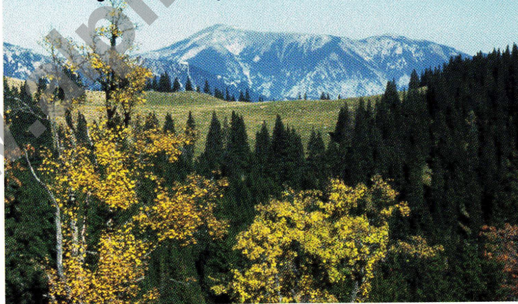
2 EDELWEISS-Arbeitsgebiete: Blick von der Kampalpe hinüber zum Schneeberg.